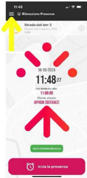
APRIRE L'APP LIBEMAX